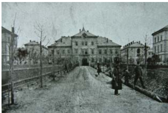
Dobový snímek dozorce a trestanců při úpravě cesty před c.k. mužskou trestnicí v Praze (Pankrác – Nusle)