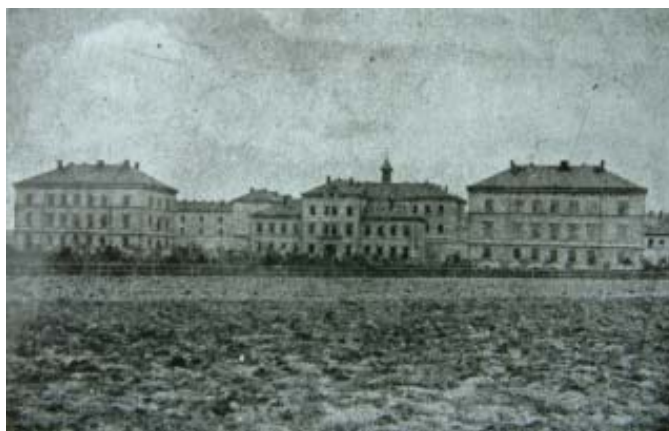
Dobový snímek c.k. mužské trestnice v Praze (Pankrác – Nusle)