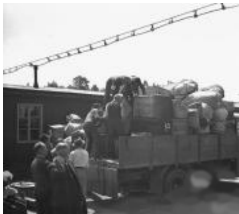
Poválečný odsun Němců z Liberce

Divoký transfer Němců se všemi nezákonnostmi a průvodními zločineckými projevy byl podhoubím pozdějšího totalitního státu, ve kterém se projevovala hluboká neúcta k lidské osobnosti, majetku, i neúcta ke kulturním tradicím. Všechny zúčastněné politické strany, ať národní demokraté, sociální demokraté nebo lidovci, umožnili bezvýhradným odsouhlasením Benešových dekretů krádež obrovského rozsahu. Tato krádež se týkala majetku tří a půl miliónu lidí. Když v únoru 1948 došlo k rozhodujícímu střetu s komunisty, byly tyto politické strany zdiskreditovány a zkorumpovány stejnou měrou jako komunisté a nebyly proto schopné čelit mohutnému nátlaku, podporovaného Moskvou.