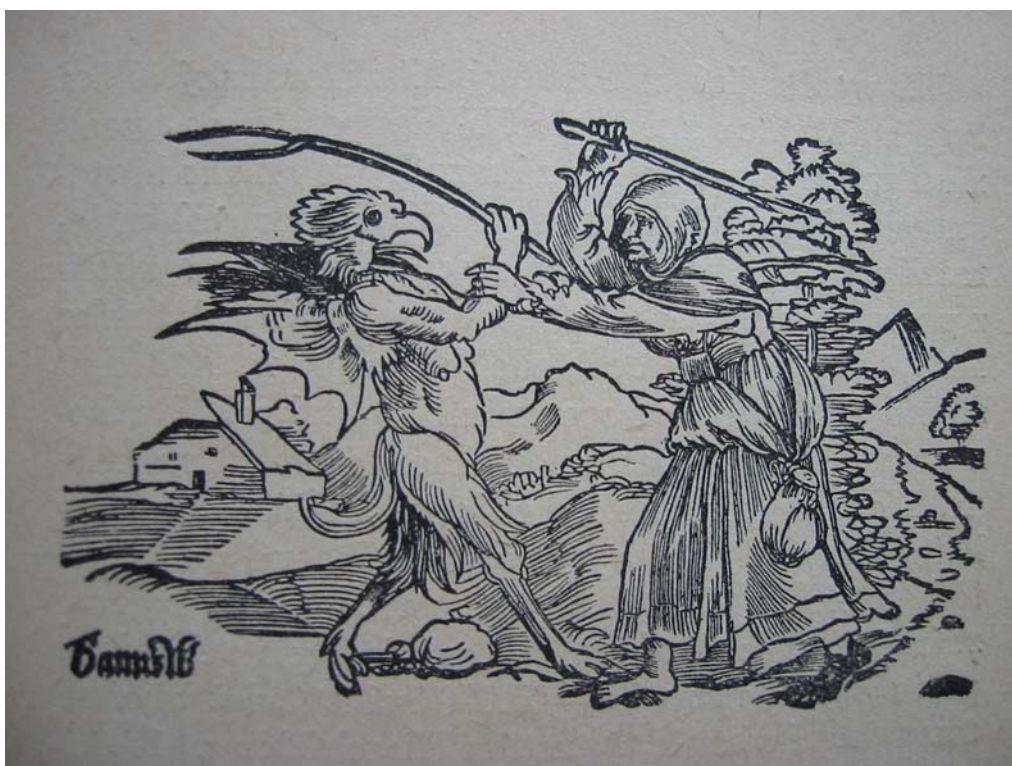
Boj báby s čertem – Německý dřevoryt

Víra ve styk s ďáblem byla tehdy velice rozšířena. Proto fantazie mučených diktovala všechno, co si mučitelé přáli. Některé ženy byly dokonce pevně přesvědčeny o tom, že se miliskovaly s ďáblem, a že jsou s ním ve spolku. Když se renesance hroutila, stávala se tato pověra hromadným, všeobecným blouzněním. Muži umírali ve válkách a žen bylo nepoměrně více. Ženy toužily po lásce a byly odhodlané jí dosáhnout za každou cenu. Cílem byly různé „nápoje lásky“, které měly vést k tomu, aby žena nabyla úplné moci nad žádoucím mužem, pomáhaly tajné recepty a zaříkání. Když se tyto praktiky staly epidemií, střízlivý každodenní život již neposkytoval uspokojení.