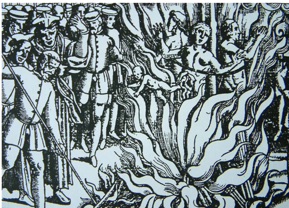
Upalování čarodějnice - dobová rytina

Víra ve zlé demony je rubem víry v dobré bohy a nelze proto jedno od druhého odloučit tak, jako je pojem chladu podmíněn pojmem tepla, nebo jako princip zla vzniká vedle principu dobra. Kdo věří v boha, musí zároveň věřit i v satana ďábla. Pro koho je svět naplněný tajemnými nadpřirozenými silami, ten musí nutně rozeznávat síly dobré a zlé. Středověk věřil ve 4,333.556 čertů a čertíků, kteří se prý skutečně sešli u smrtelného lože jedné abatyšy. Katolická církev však věnovala největší pozornost satanu ďáblu, zejména tehdy, když byla její moc ohrožena.