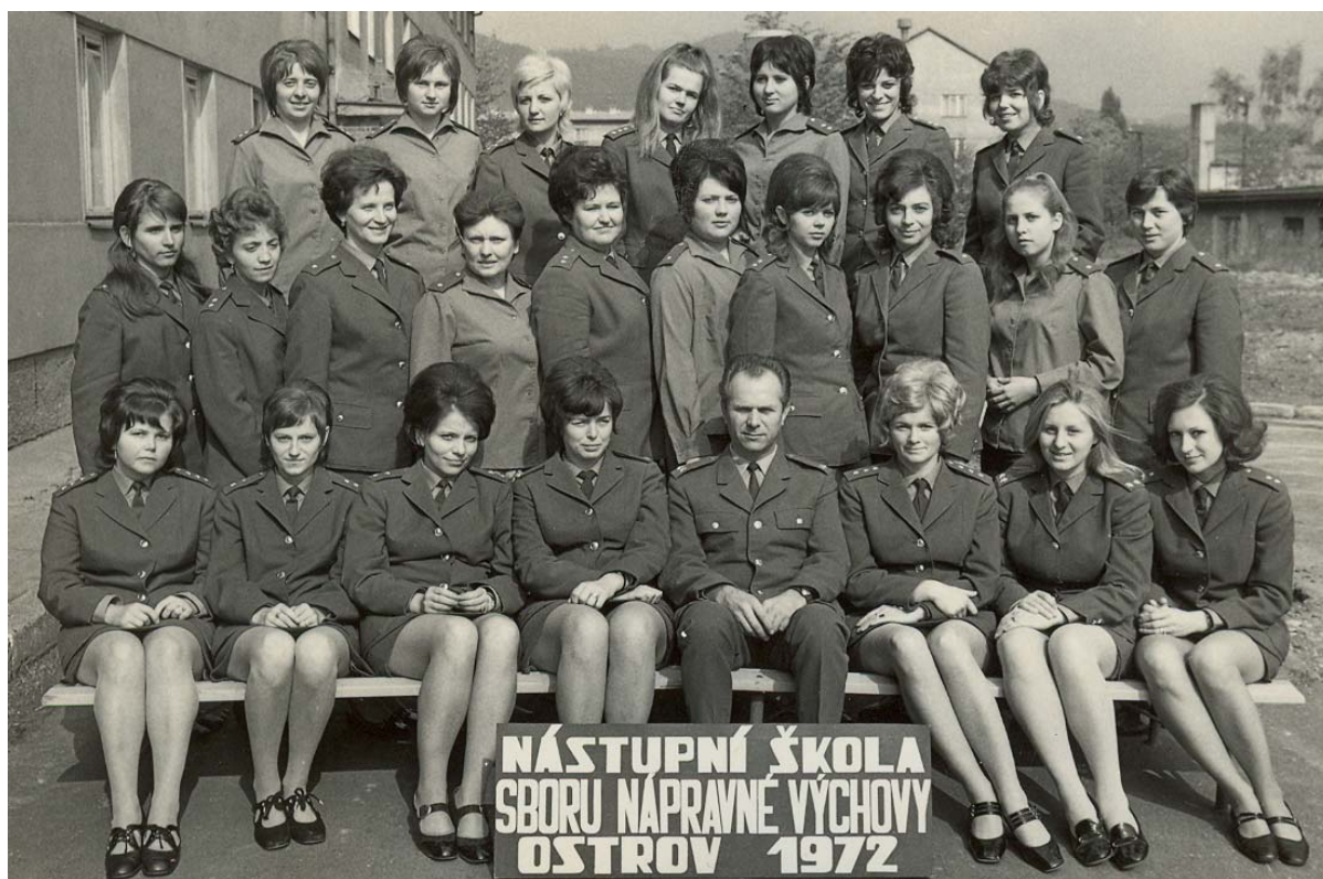
Absolventky nástupního kurzu SNV v roce 1972

nástupní kurzy (7týdenní), odborné nadstavbové studium pro maturanty (18měsíční) a střední odbornou školu s maturitou (4letou). Obsahem nástupních kurzů a služební odborné přípravy v rámci dalších forem vzdělávání byla teoretická příprava, zahrnující politickou přípravu (základy marxismu-leninismu), odbornou přípravu (základy práva, výkon vazby, výkon trestu a služební poměr), bojovou a tělesnou přípravu. V únoru 1980 byla přemístěna SOŠ SNV do objektu bývalého hornického učiliště z 50. let v Zastávce v Brna, který byl využíván i pro odbornou přípravu příslušníků SNB. V dubnu 1982 došlo k dalšímu přemístění školy do objektu Střední praporčické školy MV v Brně - Bohunicích, kde byla zřízena katedra SNV v čele s pplk. Oldřichem Kavkou, která zabezpečovala výuku a praktický výcvik posluchačů bez zásadních změn do konce roku 1989. K odbornému růstu vychovatelů a specialistů s příslušným středoškolským nebo vysokoškolským vzděláním významně přispěla činnost Výzkumného ústavu penologického SNV v letech 1966 – 1980. Tento ústav pod vedením klinického psychologa a sociologa Doc. PhDr. Jiřího Čepeláka, CSc. vzdělával příslušníky SNV v oblasti penologie a penitenciární nauky formou tematických přednášek, kurzů a postgraduálního studia, a to ve spolupráci s Výzkumným ústavem kriminologickým a Univerzitou Karlovou v Praze. Vysokoškolské studium s právnickým zaměřením pro příslušníky SNV zabezpečovala v 70. a 80. letech zejména Vysoká škola SNB, kde byla zřízena katedra penologie.