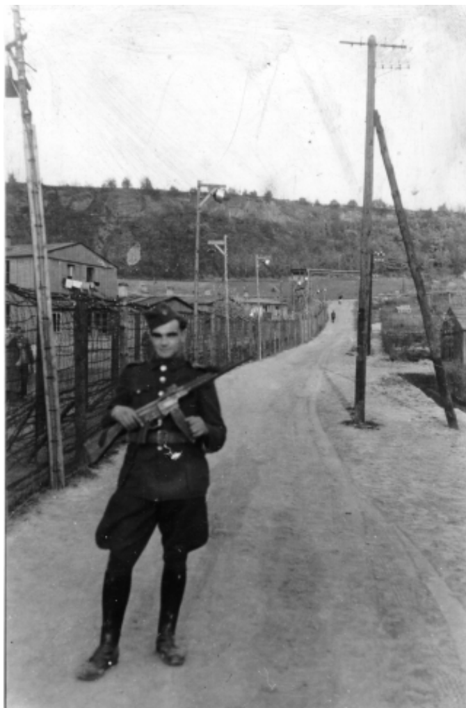
Hlídky střežící prostor internačního tábora v Rabštejně

Při „zatýkání“ v Markvarticích přišel přednosta místní železniční stanice o všechny zuby a další z „podezřelých“ o oko. Zatčení byli odvázeni na nákladních autech a během transportu si museli lehnout na korbu, aby nikdo z okolí neviděl, kdo byl zatčen. Jen přítomnost vojáka se samopalem opřeného o kabinu prozrazovala náklad. Obdobně probíhala internace i v řadě obcí soudního okresu Děčín.