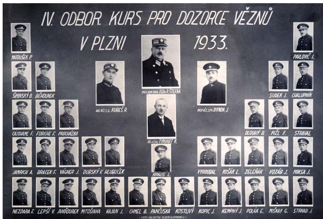
Absolventi kurzu pro dozorce v roce 1933

Dozorci vězňů byli připravováni v tříměsíčním odborném teoreticko-praktickém kurzu, zakončeném zkouškou. Noví členové dozorců stráže byli zařazováni do služby jako pomocní dozorcí vězňů na základě smlouvy s možností 14denní výpovědi. Teprve po absolvování přípravného odborného kurzu byli jmenováni jako definitivní dozorcí vězňů. Od roku 1938 byl prováděn výcvik dozorců v sebeobraně (jiu-jitsu), který započal v pankrácké soudní věznici. V Kriminologickém ústavu při právnické fakultě Univerzity Karlovy v Praze byly pořádány kriminologické kurzy i pro vězeňské úředníky. V období tzv. Protektorátu Čechy a Morava (1939 - 1945) se zásady výběru uchazečů a přípravy vězeňských dozorců a úředníků pro výkon služby prakticky nezměnily, ale od roku 1941 museli dozorcí absolvovat kurz němčiny. Až do roku 1947 byly prováděny odborné zkoušky, předepsané k dosažení služebních míst úředníků vězeňské strážní a správní služby, které zahrnovaly předměty všeobecného vzdělání: státní jazyk, počty a měřičství, občanskou nauku, společenskou výchovu a zdravotvědu a předměty odborné: trestní právo, kriminální psychologii a sociologii, dějiny vězeňství, hospodářskou administrativu, vězeňské účetnictví, strážní službu, služební právo a platové předpisy vězeňských zaměstnanců.