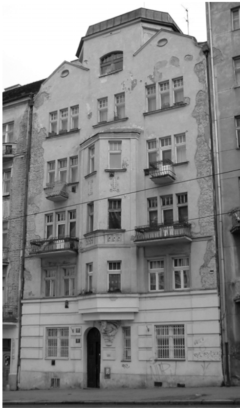
Dům čp. 24 v Tábořské ulici