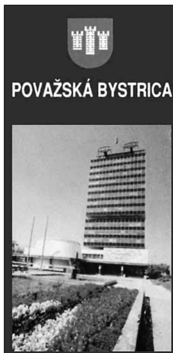
Obr. 1 – 2. Propagačné materiály mesta z 90. rokov 20. storočia.

vyhradený priestor prezentácii obchodných, kultúrnych, športových a zdravotníckych zariadení. Kultúrnym pamätihodnostiam, zastúpeným Považským hradom a Orlovským kaštieľom, bola venovaná len jedna stránka. Sakrálne budovy, ktoré už onedlho čakal prezentačný boom, boli ešte úplne vynechané, zato mali v brožúre ešte vždy miesto snímky dokumentujúce priemyselnú výrobu Považských strojární. K výraznejším zmenám v prezentácii mesta došlo až koncom 90. rokov.