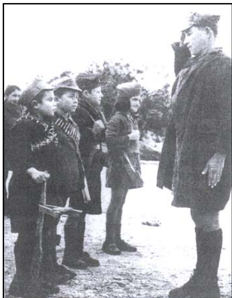
Detskí vojaci v Grécku, 1944.

Sarajeva, ktoré drží v jednej ruke vôdzku svojho raneného psíka a v druhej pištoľ. 6 Nezáleží pri tom na tom, či je táto situácia zinscenovaná alebo ide o výjav z reálneho sveta – fotografia